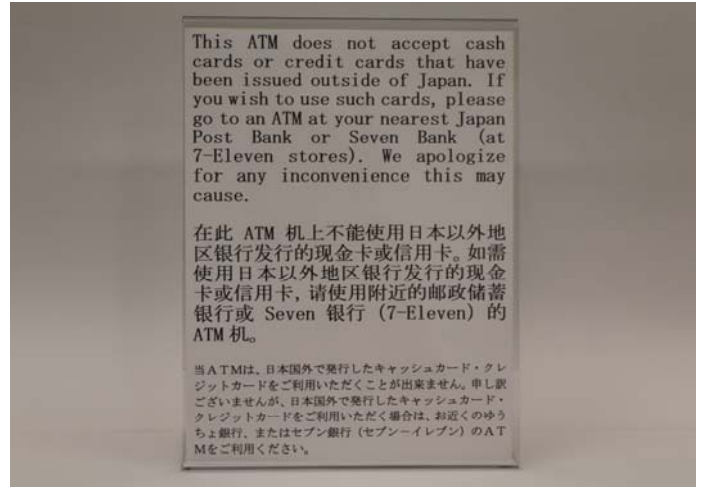
ATM 案内「多言語表記プレート」