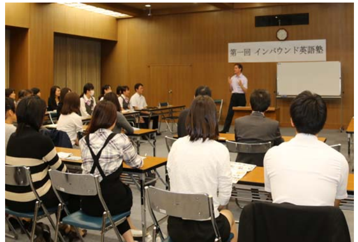
行員向け「インバウンド英語塾」の様子