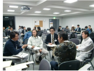
<ディスカッション>