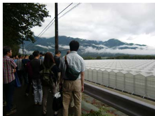
フィールドワーク