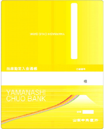
当座勘定入金通帳