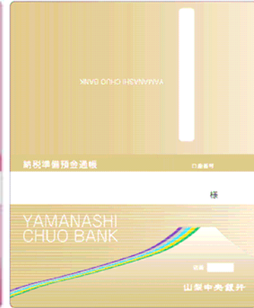
納税準備預金通帳