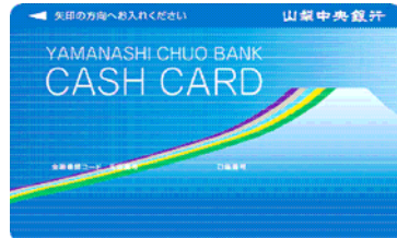
総合口座キャッシュカード