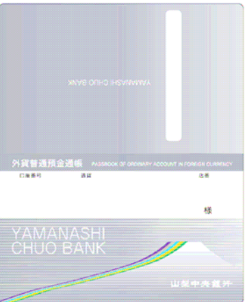
外貨普通預金通帳