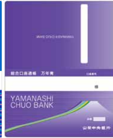
総合口座通帳 万年青