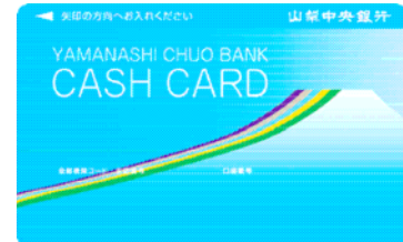
普通預金キャッシュカード