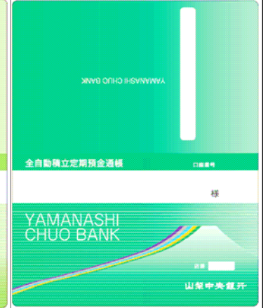
全自動積立定期預金通帳