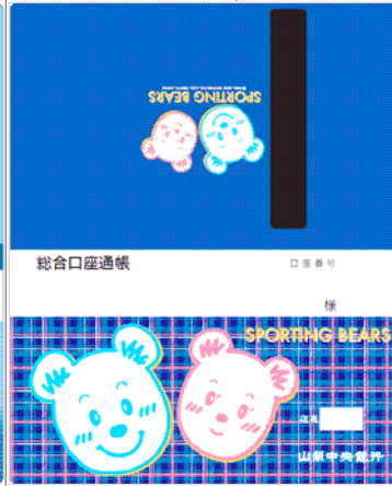
総合口座通帳(キャラクター)