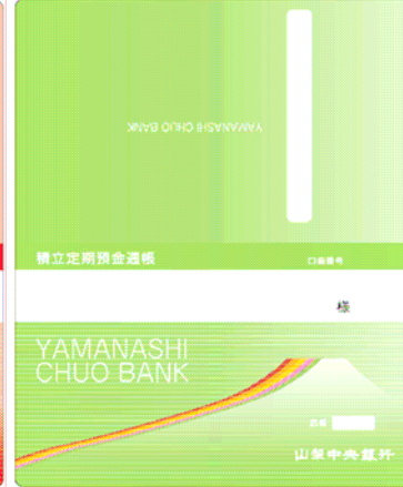
積立定期預金通帳