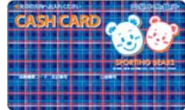
総合口座(キャラクター)キャッシュカード