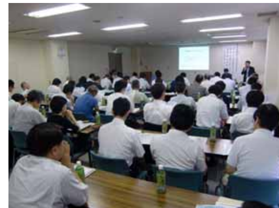
「タイ王国ビジネスセミナー」の開催模様(23.8.3)

当行では、海外市場への進出や貿易取引等について、中小企業等のお客さまが抱える悩みや課題の解決のため、さまざまなサポートを提供してまいります。