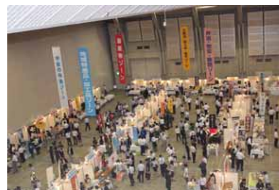
「やまなし食のマッチングフェア2011」の開催模様 (23.7.6)