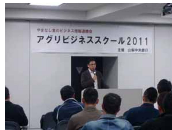
「アグリビジネススクール2011」の開催模様

当行では、お客さまニーズに応じた様々な交流機会などのご提供を通じて、地域経済の活性化、地域産業の育成支援に積極的に取り組んでまいります。