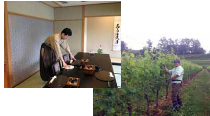
【外部企業で働く当行行員】

今年度は、宝飾、ワイン、織物等の地場産業を中心とした企業10社に各1名を派遣し、派遣された行員は実際にその業務を経験・体験することで、各々の業界の特性やノウハウの習得に努めました。