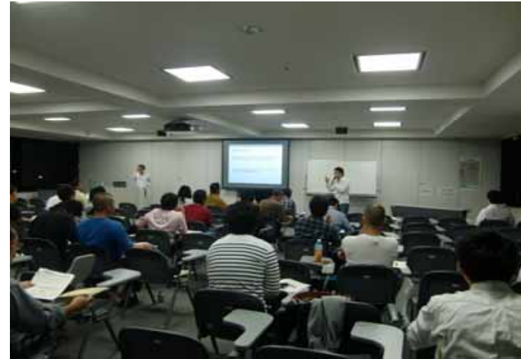
【「アグリビジネススクール2012」の開催模様】

当行では、お客さまニーズに応じたさまざまな交流機会などのご提供を通じて、地域経済の活性化、地域産業の育成支援に積極的に取り組んでまいります。