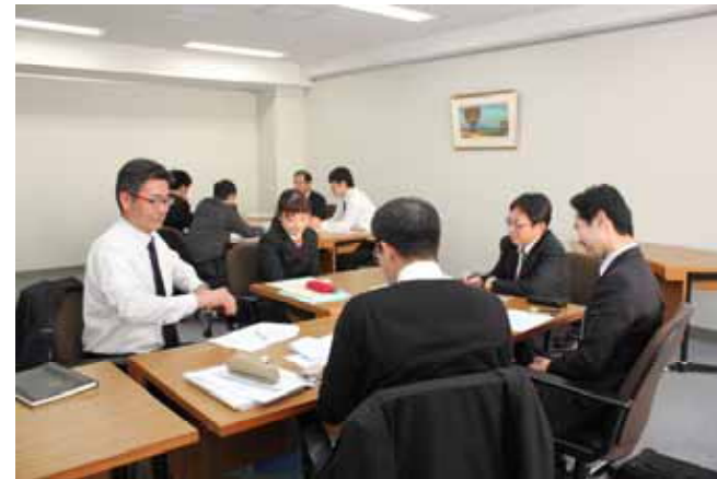
【リニア活用PTの活動の様子】

当行では、金融資料館へご来館いただいたお客さまを対象とした文化イベント「『甲州財閥検定』～山梨の歴史を拓いた偉人」を開催するとともに、山梨県内の小中学校の校外学習の場として金融資料館を提供するなど、貴重な文献や資料をご覧いただくことを通じて、ご来館の皆さまに山梨県の歴史やお金についての理解を深めていただきました。