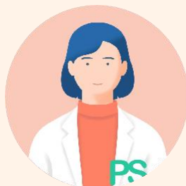
パシエントサポーター