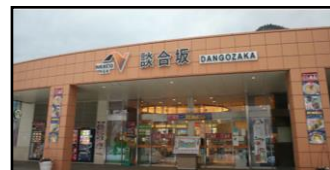
「談合坂 SA ①」