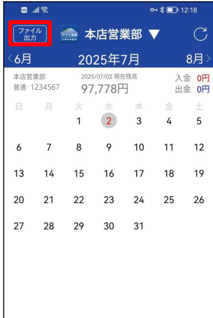
① 左上の「ファイル出力」をタップ