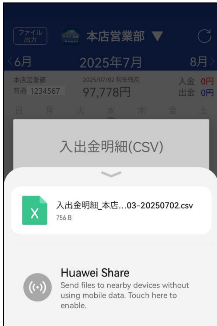
④ 出力画面に遷移するのでご希望の操作を行ってください