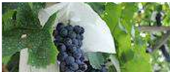
第2回 5月29日(金)～30日(土) 葡萄の傘かけ体験