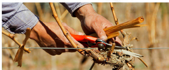
第1回 1月23日(金)～24日(土) 葡萄の剪定体験