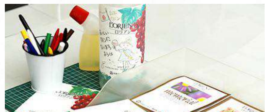
第4回 11月27日(金)～28日(土) ワインの瓶詰・オリジナルラベル作りと貼付体験