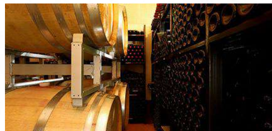
第3回 9月25日(金)～26日(土) 収穫・醸造体験