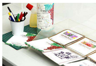
ワインの瓶詰・ オリジナルラベル作りと 貼付体験 白百合醸造で貯蔵