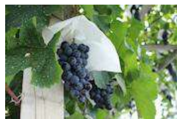
葡萄の傘かけ体験