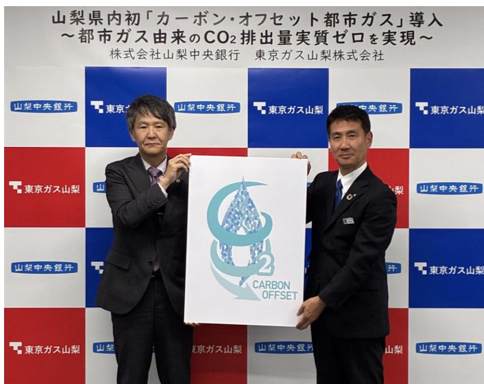
左から、当行・古屋頭取、東京ガス山梨株式会社・宮田社長