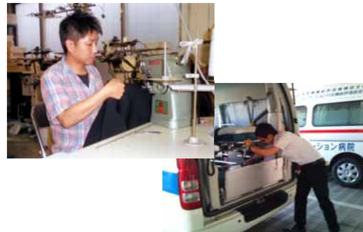
【外部企業で働く当行行員】

今年度も、宝飾、ワイン、織物等の地場産業を中心とした企業10社に各1名を派遣しており、派遣された行員は実際にその業務を経験・体験することで、各々の業界の特性やノウハウの習得に努めております。