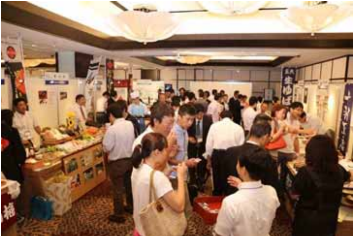
【「やまなし食のマッチングフェア2013 in TOKYO」の開催模様】

「やまなし食のマッチングフェア」は8回目の開催になりますが、今年の総来場者数は約1,000名、商談件数は2,000件を超えるなど、事業者のみなさまの販路拡大、ネットワーク拡大支援につながっております。