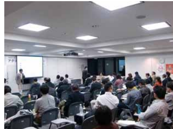
【「アグリビジネススクール2013」の開催模様】

経営感覚と起業家精神をもって新しいアグリビジネスや6次産業化に挑戦する農業経営者の育成を目的として、農業に関する流通・生産管理・マーケティングなどのマネジメント知識や経営計画の立案手法などを習得するための経営講座「アグリビジネススクール2013」を開催しております（全24回、H25/4～H26/3）。