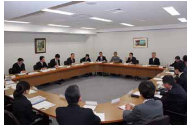
【リニア中央新幹線・中部横断自動車道活用推進PT】

当行では、金融資料館へご来館いただいたお客さまを対象とした文化イベント「山梨中銀おかねの学校」、「山梨中央銀行はこうして生まれた～近代日本金融史の流れの中で～」を開催するとともに、山梨県内の小中学校の校外学習の場として金融資料館を提供するなど、貴重な文献や資料をご覧いただくことを通じて、ご来館の皆さまに山梨県の歴史やお金についての理解を深めていただきました。