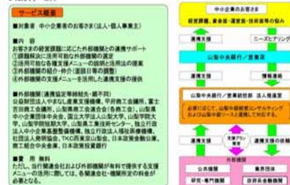
【山梨中銀経営支援コーディネートサービス】

当行グループと外部機関とのネットワークを活用し、お客さまが抱える経営課題の解決に適した機関の紹介、解決に向けた支援メニューの組み合わせ・利用提案、各機関と一体となった解決までのサポートを提供させていただきます。