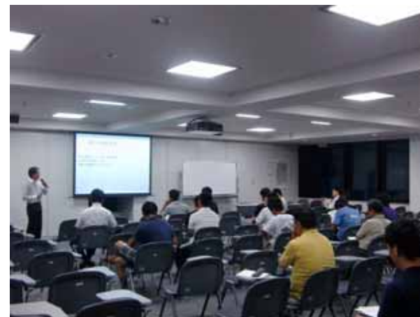
「アグリビジネススクール2011」の開催模様

当行では、お客さまニーズに応じたさまざまな交流機会などのご提供を通じて、地域経済の活性化、地域産業の育成支援に積極的に取り組んでまいります。