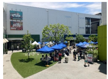
※A ブロック1階 セントラルコート出店イメージ