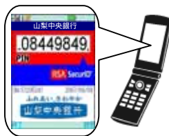
トークン（携帯アプリ）

お客さまの携帯電話にメール送信されたURLから「トークン」のダウンロードを行い、画面に従って初期設定を行います。