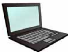
インターネットバンキング

パソコンから山梨中銀ダイレクトにログインし、ワンタイムパスワード申請メニューで「トークン発行」申請を行います。